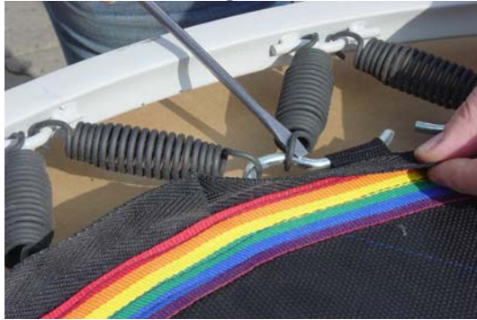
Ausbau - Dismounting – Démonter

Remplacer les ressorts comme montré avec un tourne-vis en utilisant l'effet de levier