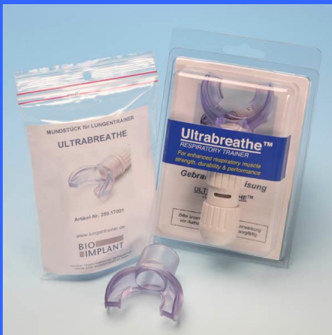
Auch lieferbar: Mundstück (solo) und Ultrabreathe & Mundstück-Set